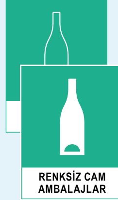
RENKSİZ CAM AMBALAJLAR