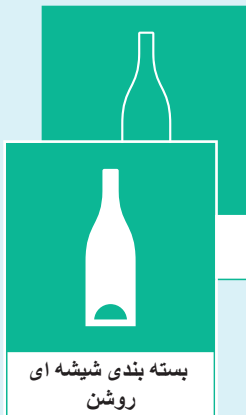
بسته بندی شیشه ای روشن

✗ بطری های قابل بازگشت برای سپرده در فروشگاه سپرده می شود. پرسلن، سرامیک و سایر محصولات غیر از آنها بسته بندی چپ به عنوان زباله های بزرگ یا خانگی محسوب می شود. گروپ ها و گروپ های ریسمان دار و لوله های فلورسنت معمولاً در مراکز بازیافت کمون سپرده می شود.