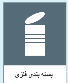
بسته بندی فلزی

✗ قوطی های حاوی رنگ و باقی مانده چسب به عنوان زباله های خطرناک دفع می شوند. فلزات قراضه، اجزای لوله کشی، ماهیتابه ها و سایر محصولاتی که بسته بندی نیستند، به عنوان زباله های بزرگ یا خانگی دفع می شوند. قوطی های قابل بازگشت برای سپرده در فروشگاه باقی می مانند.