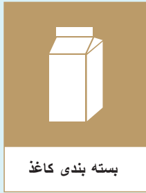
بسته بندی کاغذ

✗ پاکت ها در زباله های خانگی یا زباله های قابل احتراق قرار بگیرند. روزنامه ها، بروشور ها و امسال آن در بخش روزنامه قرار داده شود.