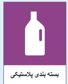
بسته بندی پلاستیکی

✗ محصولات پلاستیکی که بسته بندی نیستند به عنوان زباله های بزرگ یا خانگی مانند مبلمان و اسباب بازی ها دفع می شوند. بطری های قابل بازگشت برای سپرده در فروشگاه باقی مانده است.